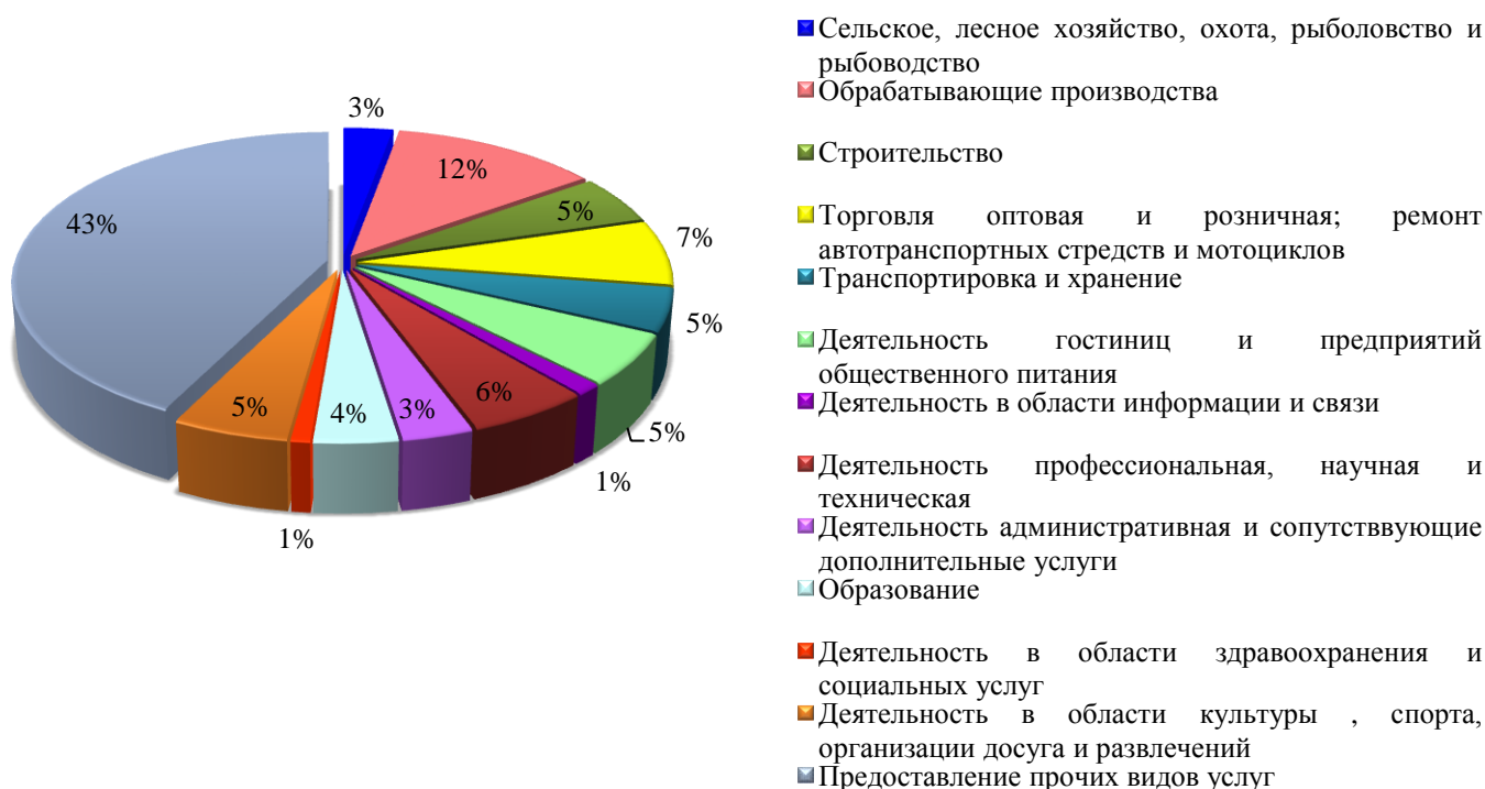
Рис.3 - Основные направления развития бизнеса в январе – декабре 2019 года

Численность граждан, открывших собственное дело в 2019 году, составила 343 человека, в том числе 337 человек зарегистрировали индивидуальную предпринимательскую деятельность, из них 2 человека – крестьянское (фермерское) хозяйство и 6 человек зарегистрировали юридическое лицо.