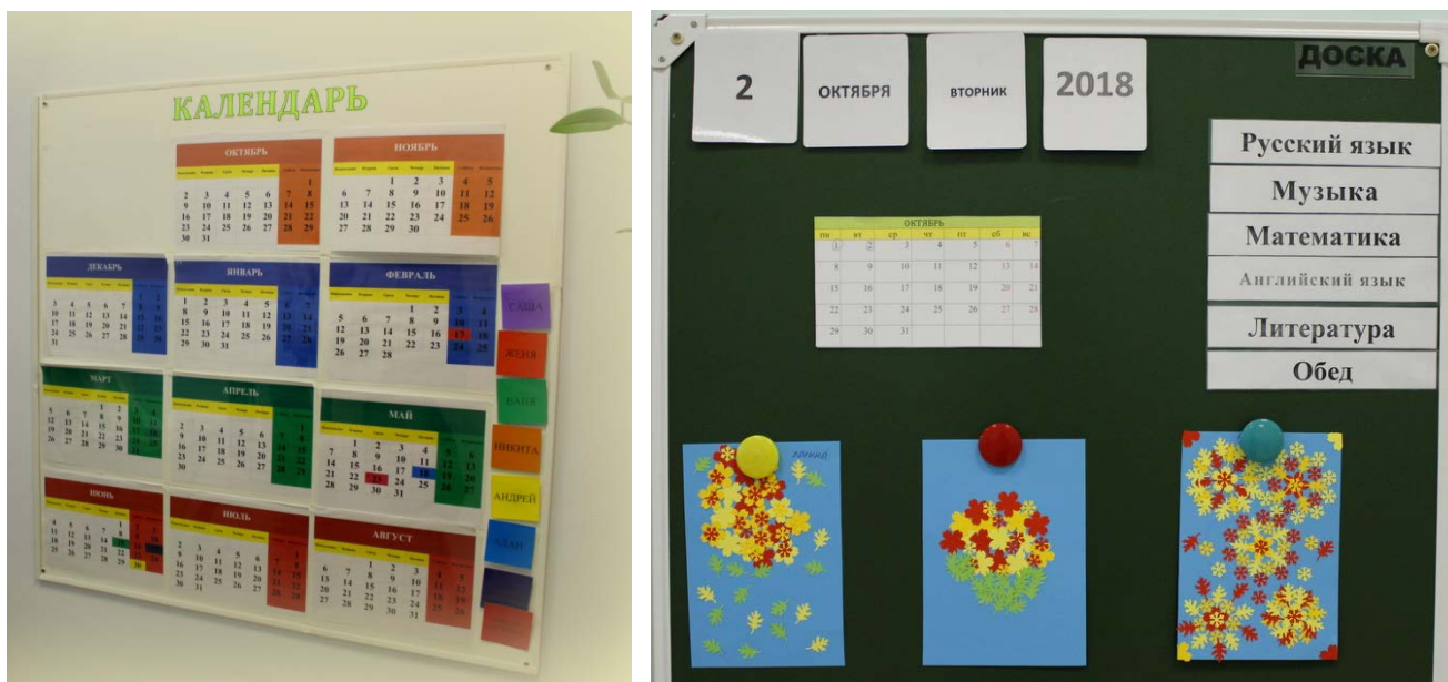
Рисунок 8. Оформление доски, календарь

Как известно, дети с РАС испытывают значительные трудности в освоении пространственно-временных понятий. Для формирования временных отношений необходима систематическая работа. И в учебной зоне должно быть предусмотрено пространство для работы с календарем: календарь на текущий год, текущий сезон, текущий месяц (с возможностью отмечать текущий день).