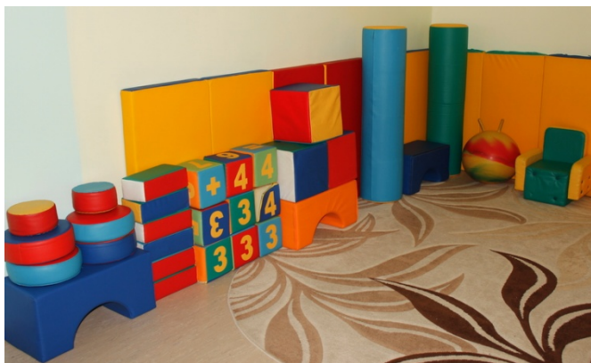
Рисунок 9. Зона сенсорной разгрузки