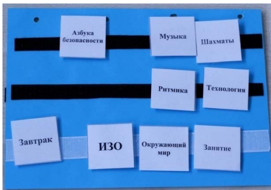
Рисунок 4. Личное расписание